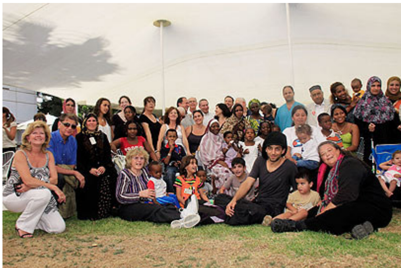
מתנדבים, אנשי צוות והילדים, אתמול